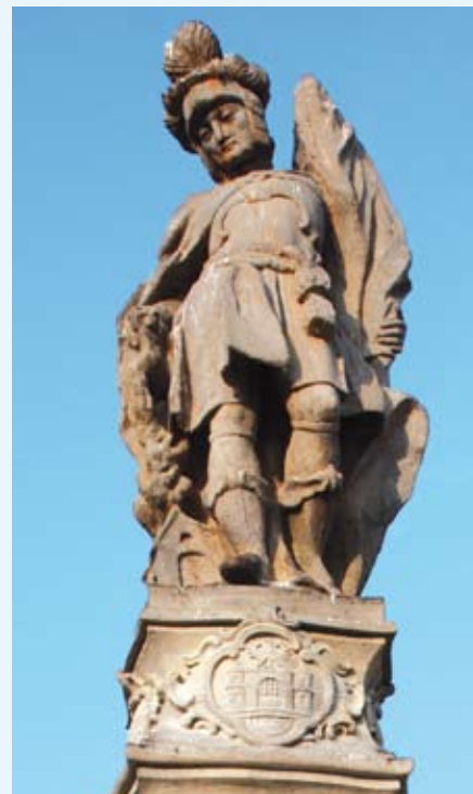
Św. Florian, fot. R. Karpińska.

Podczas uroczystości 25-lecia przynależności do urzędu w Opawie i zarazem